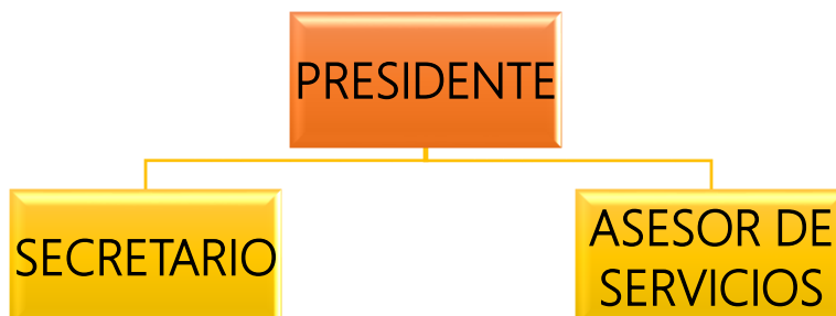
Ilustración 1. Organigrama Comité PESV.

Los integrantes del Comité del Seguridad Vial están conformados por un presidente, secretario y Asesor de Servicios cada uno con sus respectivos suplentes, como se muestra en el siguiente organigrama del comité PESV.